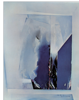
1974년 국전 대통령상 서양화 2부, 유희영 <부활>

24회 서양화 강정완 <회고>가 대통령상을 받았다. 그러던 것이 1977년 26회부터 봄 국전에 서예, 공예, 건축, 사진, 가을 국전에 동양화, 서양화, 조각을 1부: 구상, 2부: 비구상으로 나누어