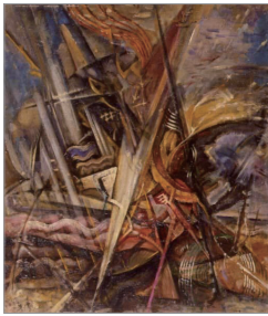
주경 <파란>, 1923

추상미술이란 개념은 대상을 알아볼 수 있게 표현한 구상미술의 반대 개념인 비구상미술과 동일시하기도 한다. 우리는 최초의 추상화로 주경의 1923년 <파란>(국립현대미술관 소장)을 꼽기도 한다. 본격적인 대두는 1930년대의 동경유학생인 김환기, 유영국, 이중섭, 문학수 등이 관전을 외면하고 전위적인 그룹 '자유미술가협회', '미술문화협회', '백만회' 등을 통해 모더니즘 작품을 발표한 때부터이다.